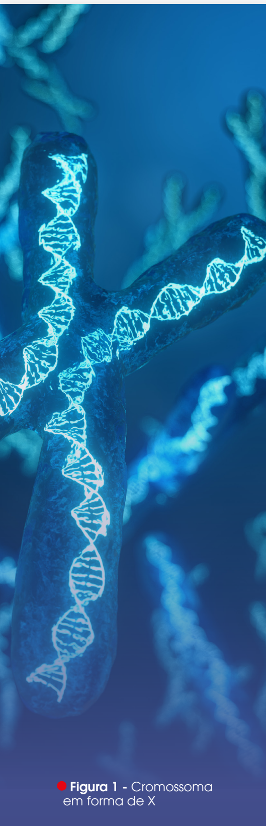
● Figura 1 - Cromossoma em forma de X